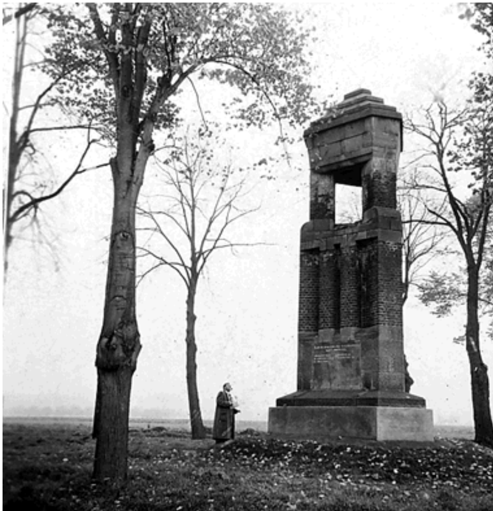
FOTO UIT DE OUDE DOOS: Monument aan de Blauwenhoek te Londerzeel anno 1955.

De naam mag ons vertrouwd in de oren klinken, het blijft een moeilijke en wat raadselachtige naam.